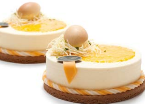
Voorjaarstaart met marsepein narcisjes (10 - 12 p) € 43,50