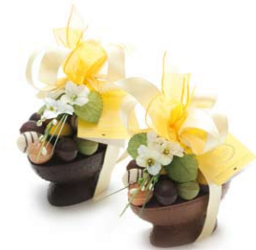
Chocolade ei (in melk & puur) met paaseitjes € 29,95