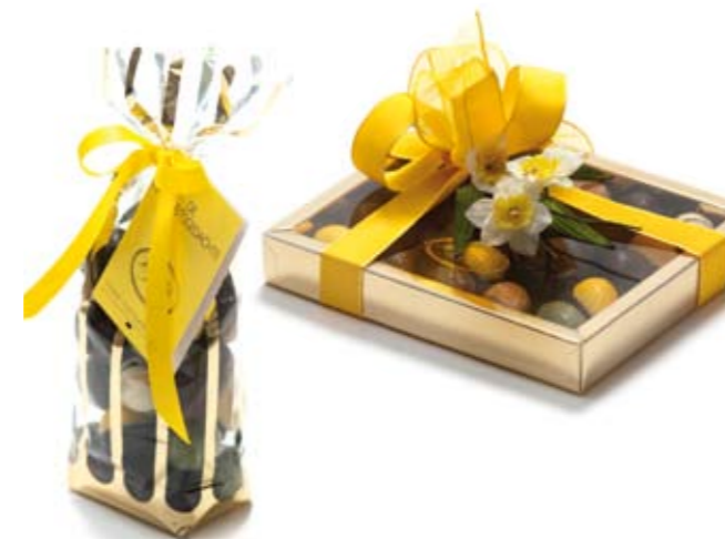
Koker Gianduja-Marsepein spiegeleitjes € 17,50

Koker is tevens met chocolade paaseitjes verkrijgbaar € 17,50