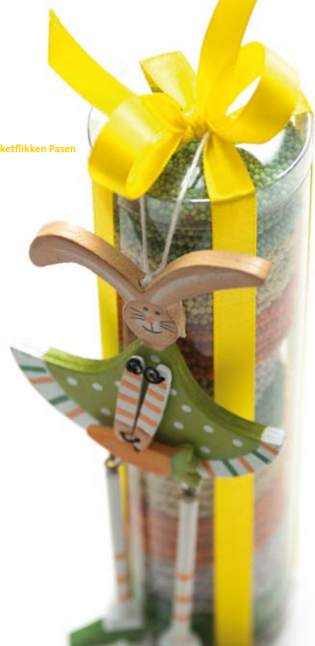
Koker musketflikken Pasen € 14,95

info@huizevanwely.nl www.huizevanwely.nl