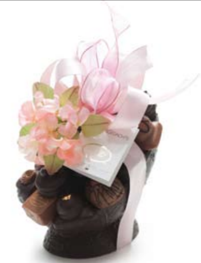
Chocolade ei klein (in melk & puur) met bonbons € 36,95