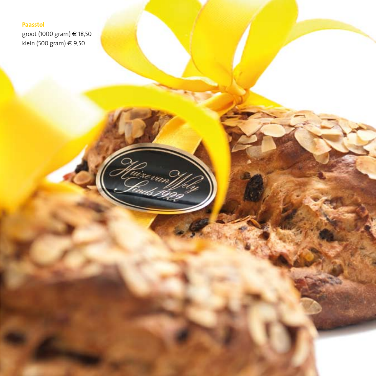
Paasstol groot (1000 gram) € 18,50 klein (500 gram) € 9,50