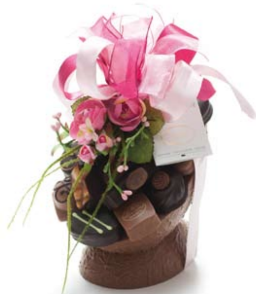
Schuin chocolade ei groot (in melk & puur) met bonbons € 69,50