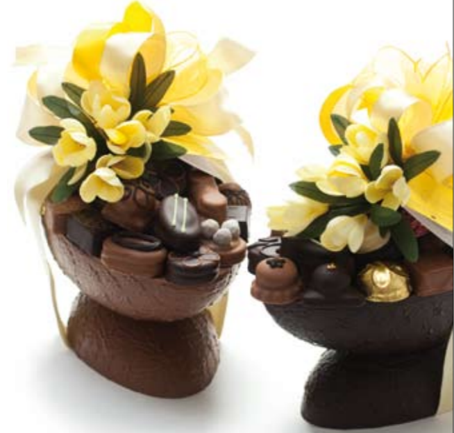
Chocolade ei groot (in melk & puur) met bonbons € 97,50